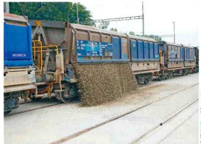
Die Anlieferung der gebrochenen Rohkörnungen per Blockzug ermöglicht auch zukünftig die nachhaltige überregionale Versorgung • The delivery of the crushed raw aggregates by block train will also enable sustainable supra-regional supply in the future