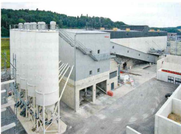
Das BGO-Betonwerk und das Hochsilolager im Recyclingzentrum Vufflens-la-Ville grenzen unmittelbar aneinander an • The BGO concrete mixing plant and the high silo storage facility at the Vufflens-la-Ville recycling centre are directly adjacent to each other

The new plant of Béton Granulats Ouest Lausannois SA (BGO) will fulfil important tasks within the regional circular economy. With a targeted annual production of around 100000 m 3 of all common concrete types according to Swiss standards and a large number of individually adjustable recipes, BGO fully meets the requirements of regional customers and scores with high availability and short distances. The same applies to the storage facility with its estimated annual turnover of around