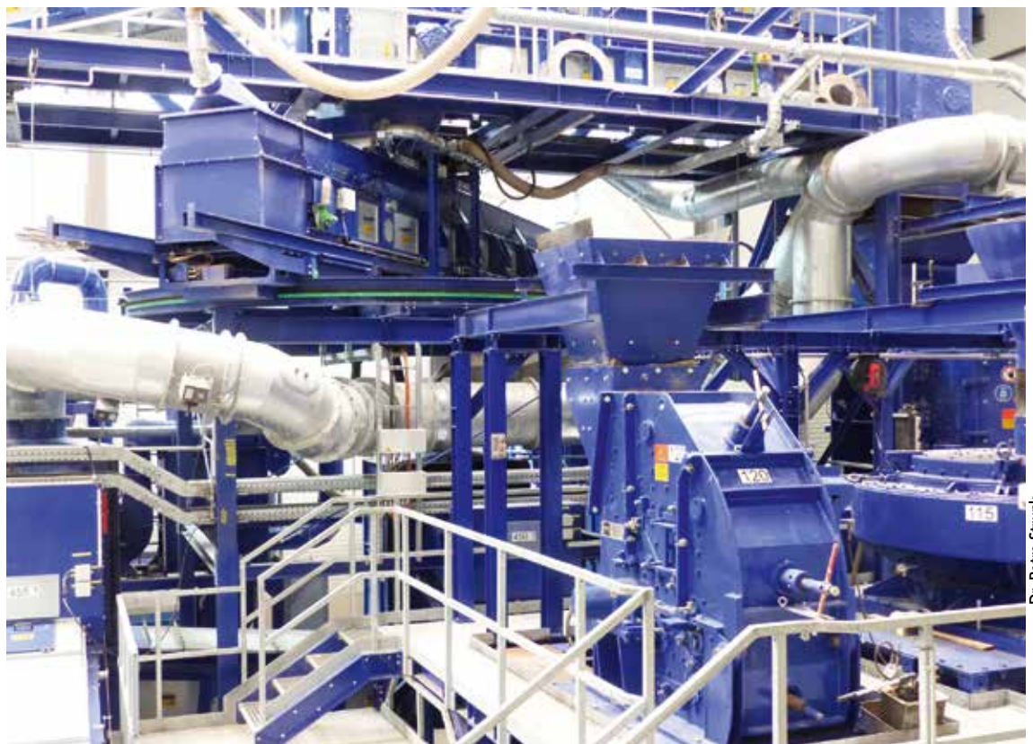
Dr. Petra Strunk

Seit 2019 können im neuen Test Center Kundenmaterialien testweise aufbereitet werden, um z.B. die Auslegung des Feinaufbereitungsprozesses genau abzustimmen